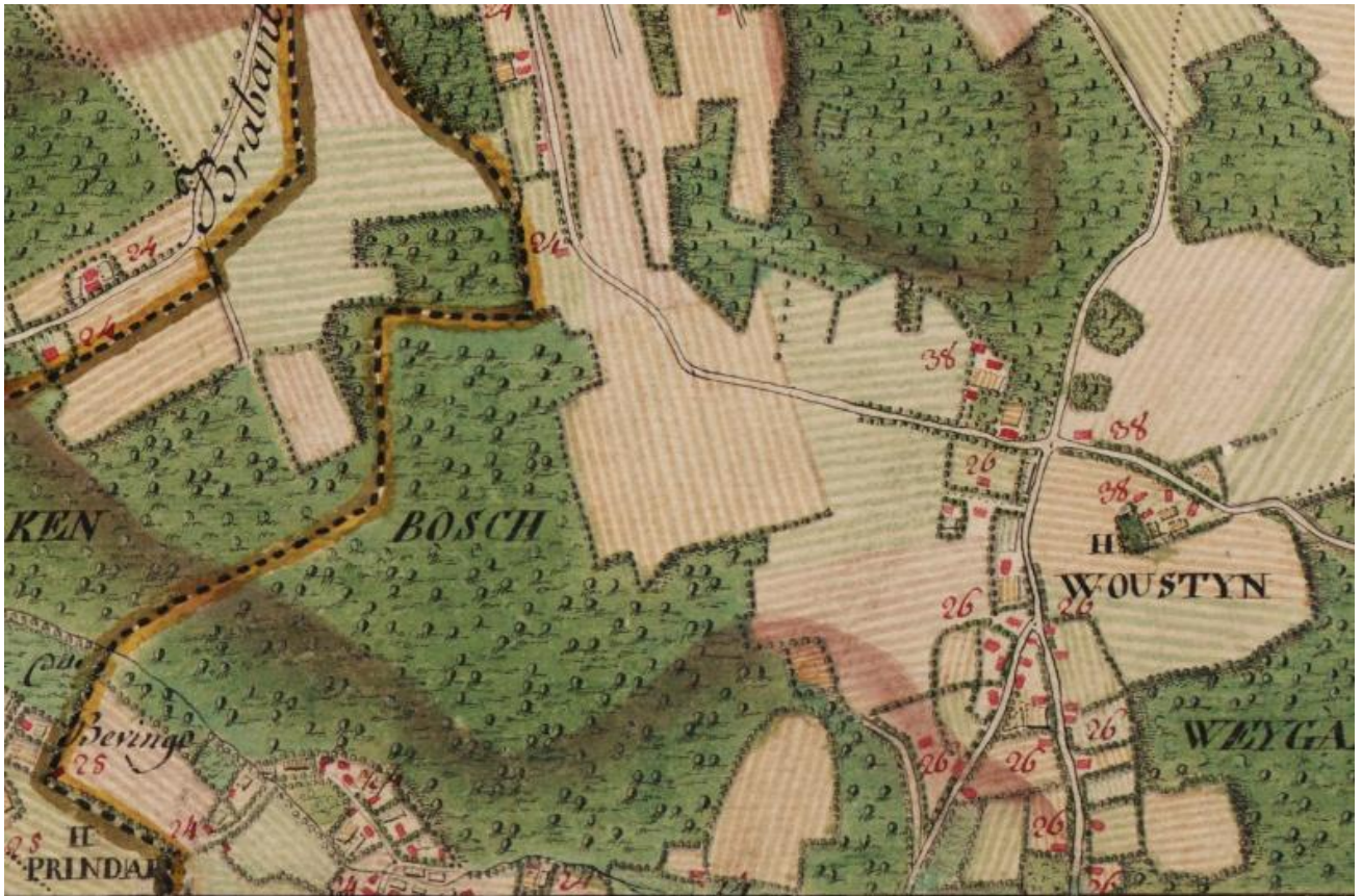
Fragment uit de Ferrariskaart met het gehucht Woestijn en rechts ervan nog de uitlopers van het Weygaertbosch. We zitten hier naar het noorden toe aan de grens met Pamel (cijfer 38). Naar het westen ligt de grens met het graafschap Vlaanderen. Het gehucht Prindael ligt er onder Neigem (cijfer 28). Het Hakenbosch ligt deels binnen Neigem en deels binnen Gooik.