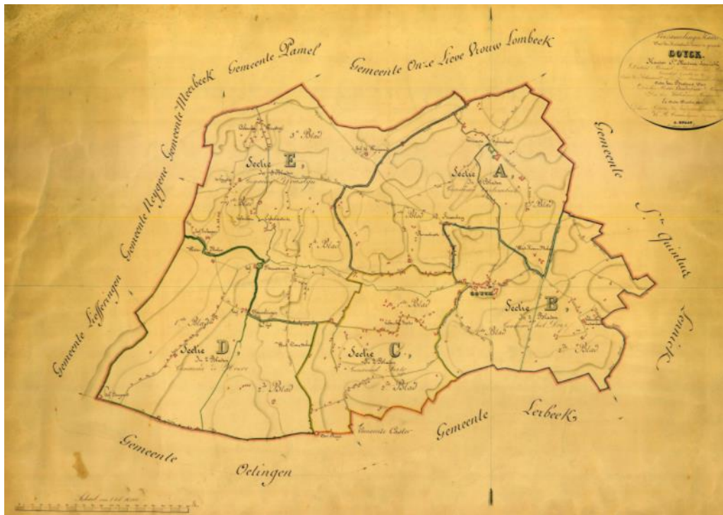
Gooik ingedeeld in secties op de oude Knaap-kaart (1830-1834) 5

De parochie of het dorp Gooik met een oppervlakte van 1013 bunders 2 (=ongeveer 13 km 2 ) werd omgeven door Pamel en Onze-Lieve-Vrouw-Lombeek in het noorden, Sint-Kwinten-Lennik in het oosten, Oetingen, Leerbeek en een stukje Kester in het zuiden, en door Liefeninge, Neigem en Meerbeke 3 in het westen. Deze laatste drie dorpen lagen in het toenmalige graafschap Vlaanderen, terwijl Oetingen en Kester 4 binnen het Land van Edingen lagen (=graafschap Henegouwen).